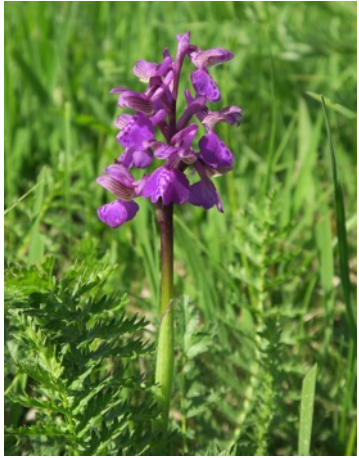
Kleines Knabenkraut ( Anacamptis morio ), April-Mai