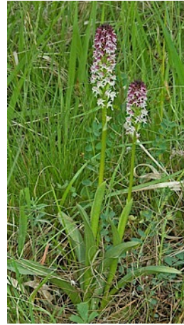
Brandknabenkraut ( Neotinea ustulata ), Mai