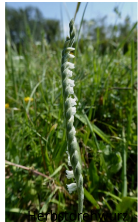
( Spiranthes spiralis ), August-September