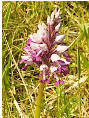
Helm Knabenkraut ( Orchis militaris ), Mai