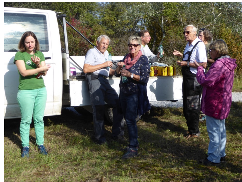
Freiwillige MitarbeiterInnen der ÖGG und des ÖON, bei den Rechenarbeiten und der wohlverdienten Jause.