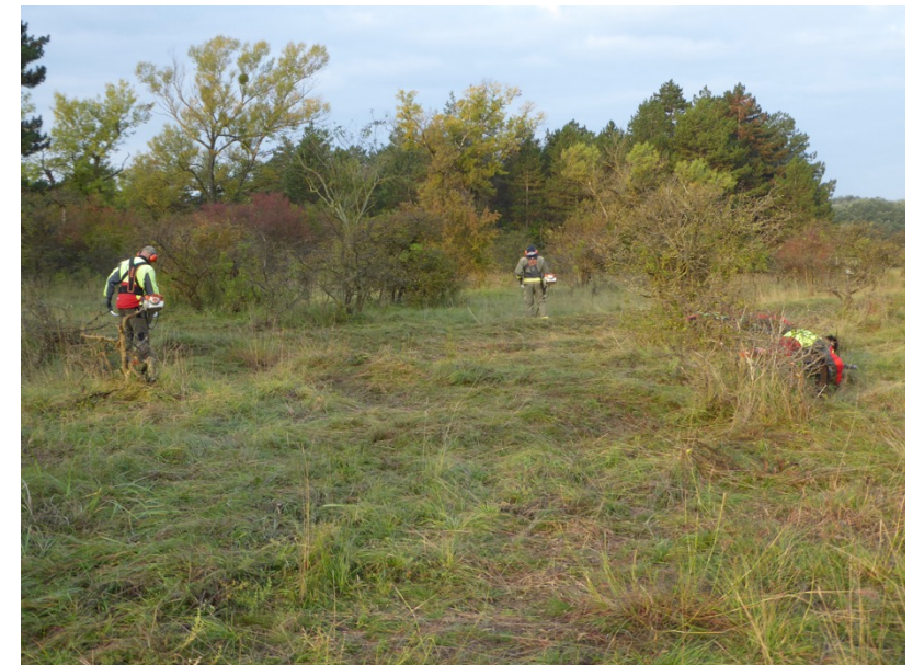
Mitarbeiter der Forstverwaltung (MA49) beim Mähen.