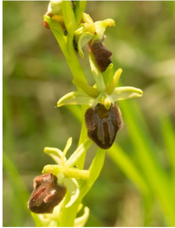
Spinnen Ragwurz ( Ophrys sphegodes ), April-Mai