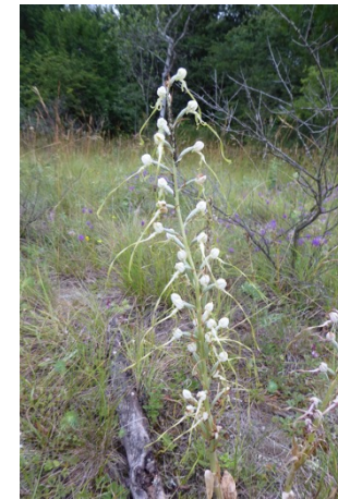
Adriatische Riemenzunge,weisses Exemplar ( Himantoglossum adriaticum ), Juni