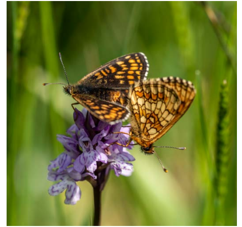
Wachtelweizen-Scheckenfalter auf D. fuchsii