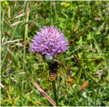
Veränderliche Krabbenspinne auf T. globosa