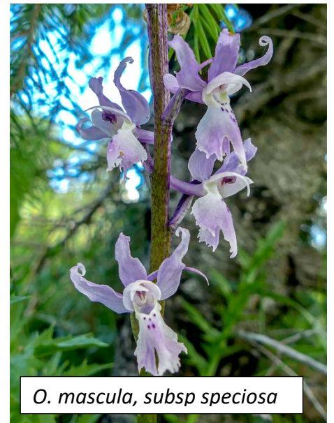
O. mascula, subsp. speciosa