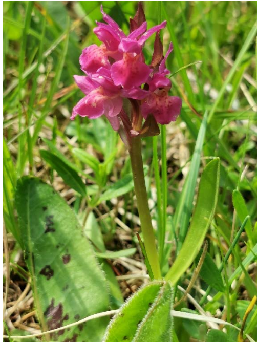
D. sambucina in Rot

Danach entdeckten wir eines der Highlights dieser Wanderung: Eine wunderschön blühende Dactylorhiza x rupertii ( D. majalis x D. sambucina ). Inmitten der Elternpflanzen stach diese rosafarbene wunderschöne Kreuzung heraus.