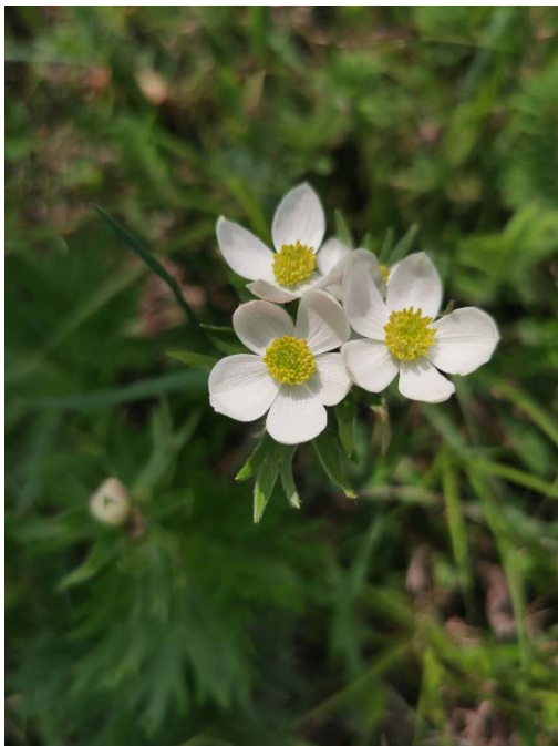
A. narcissiflora , Narzissen-Windröschen

Auf der Wiese blühten des Weiteren wunderschöne Narzissen-Windröschen ( Anemone narcissiflora ) und Frühlings-Enziane ( Gentiana verna ).