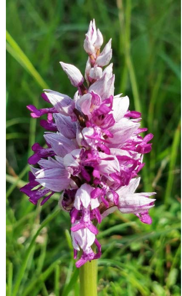
O. militaris , Helm-Knabenkraut