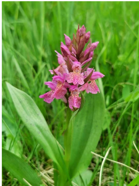
Dactylorhiza x rupertii