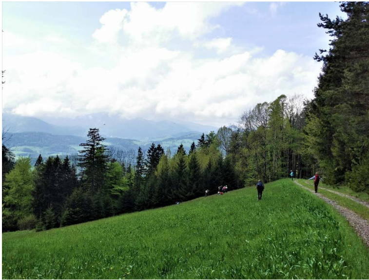
Fleißige Fotografen auf der Kleewiese

Nachdem jede*r ausgiebig fotografiert hatte, entdeckten wir noch einige D. majalis . Fuchs-Fingerwurz ( D. fuchsii ) und noch nicht blühende Händelwurz ( Gymnadenia sp.) konnten auch bestaunt werden.