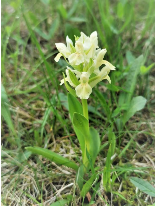
D. sambucina in Gelb

Nach kurzem steilen Aufstieg zur Kleewiese erwarteten uns dort ein paar Holunder-Fingerwurzeln ( Dactylorhiza sambucina ) in Gelb und Rot.