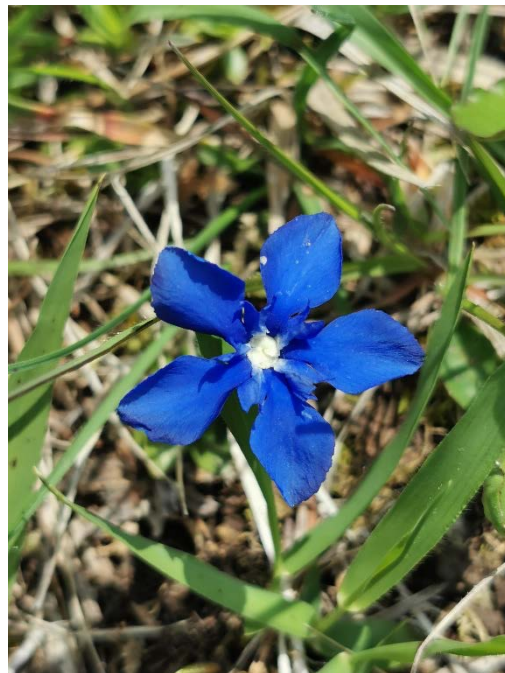
Gentiana verna , Frühlings-Enzian